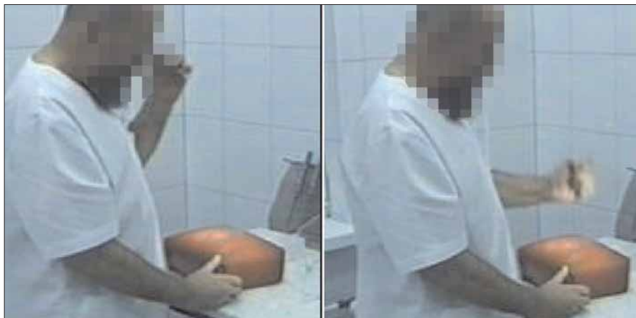
Z powstałego roztworu pobiera się jedną kroplę, dodaje 99 kropli wody i 10 razy uderza się w skórzaną poduszkę.

Przytoczony tekst jest cytatem z Jej wy- stąpienia w filmie „Tajemnica homeopatii” (TV Polsat). Z tego samego źródła pochodzą zamieszczone poniżej zdjęcia (które prezen- tuję za zgodą reżysera L. Dokowicza).