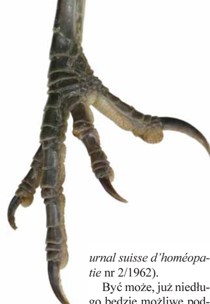
urnal suisse d'homéopa- tie nr 2/1962).

2 TYLKO LEKARSTWO ZNA CHOREGO. ZNA GO LEPIEJ NIŻ LEKARZ, LEPIEJ NIŻ SAM PACJENT ZNA SIEBIE. WIE ONO, GDZIE ZNAJ- DUJE SIĘ ŹRÓDŁO ZAKŁÓCONEGO PORZĄDKU, ZNA SPOSÓB DOTAR- CIA DO NIEGO. ANI LEKARZ, ANI CHORY NIE POSIADAJĄ TAKIEJ MĄDROŚCI I WIEDZY... (dr Baur, Jo-